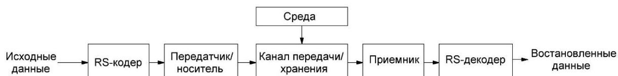
Рисунок 2 – Обобщенная структурная схема канала передачи данных телеметрической системы

Для контроля целостности данных предлагается использовать циклические избыточные коды (CRC). Алгоритм CRC базируется на свойствах деления с остатком двоичных многочленов, то есть многочленов над конечным полем GF(2) . Значение CRC является по сути остатком от деления многочлена, соответствующего входным данным, на некий фиксированный порождающий многочлен. Количество различных многочленов степени, меньшей N , равно 2^N , что совпадает с числом всех двоичных последовательностей длины N . Значение контрольной суммы в алгоритме с порождающим многочленом G(x) степени N определяется как битовая последовательность длины N , представляющая многочлен R(x) , получившийся в остатке при делении многочлена R(x) , представляющего входной поток бит, на многочлен G(x) :