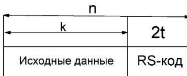
Рисунок 3 – Структурная схема пакета данных

В помехоустойчивом кодировании широко применяется код Рида – Соломона. При использовании этого кода на выходе кодера образуется избыточное сообщение для дальнейшей передачи. В кодах Рида-Соломона сообщение представляется в виде набора символов некоторого алфавита. При построении кода Рида-Соломона задается пара чисел N, K , где N – общее количество символов, а K – «полезное» количество символов, остальные N - K символов представляют собой избыточный код, предназначенный для восстановления ошибок. Структура данных в этом случае имеет вид, представленный на рисунке 3.