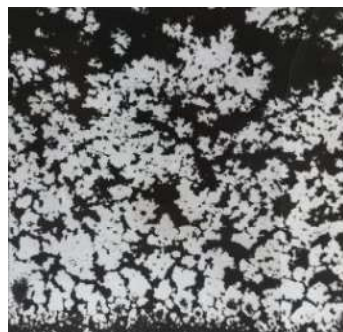
Рис. 4. Фотография шлифа капиллярной структуры тепловой трубы, полученной методом вибрационного формования