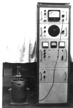
Рис. 1. Вибрационный стенд ВЭДС-10А Fig. 1. Vibration stand VEDS-10A

Среди разнообразных технологических способов и приемов получения пористых материалов с заданным распределением пор можно выделить метод виброформования, заключающийся в наложении вибрационных колебаний на форму с порошком [6]. Получить необходимое распределение пор таким методом можно при грамотном выборе размеров частиц, их формы, а также параметров вибрационных колебаний. Это позволит достичь необходимой укладки частиц по размерам (плотности укладки), размера пор, извилистости и длины поровых каналов. Исследования влияния вибрационных колебаний на распределение размеров пор по толщине образца проводились с применением вибрационного стенда ВЭДС 10-А, представленного на рис. 1 [7].