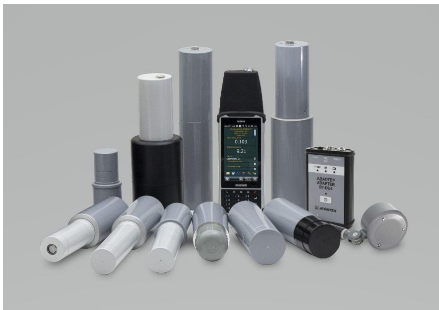
Рис. 1. Внешний вид дозиметра-радиометра МКС-АТ1117М на основе карманного планшетного компьютера (КПК) с блоками обработки информации и блоками детектирования гамма-излучения

В аппаратной части комплекс представляет из себя компьютер для тренера и дозиметры-радиометры МКС-АТ1117М с блоками обработки информации на основе карманного планшетного компьютера (КПК) и блоками детектирования гамма-излучения для тренируемых (рис. 1).