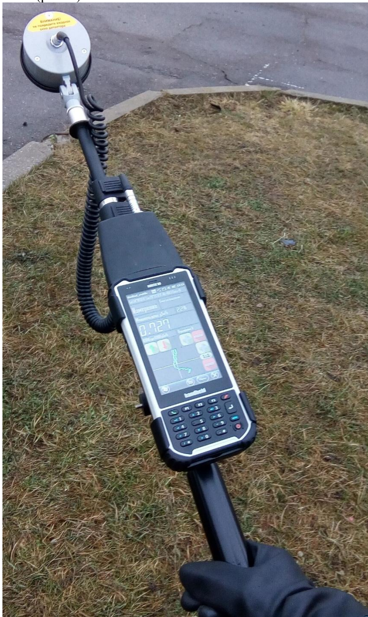
Рис. 4. Работа КПК с ПО «SimRadMobile» во время проведения обучающей тренировки

Координаты местоположения участника определяются с помощью встроенного в КПК GPS-модуля. При движении участника в автоматическом режиме составляется карта загрязнения местности (рис .4).