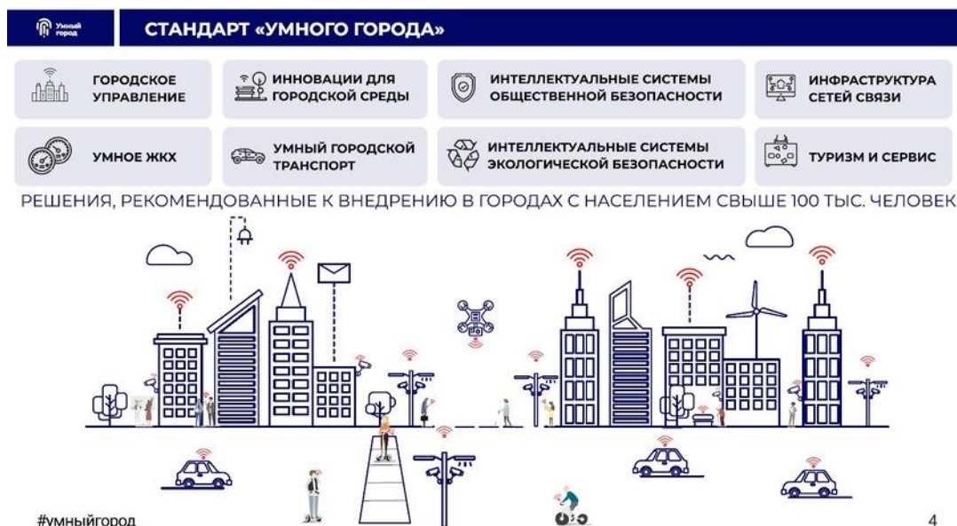
Рисунок 1. Компоненты умного города