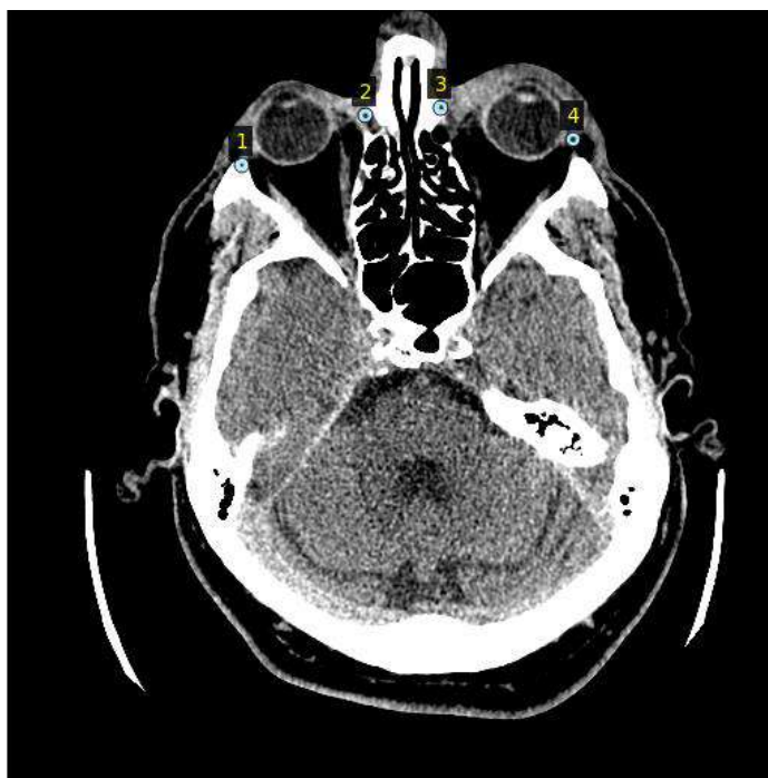
Рисунок 1 – Пример входного изображения после анализа нейронной сетью: цифрами 1, 2, 3, 4 отмечены обнаруженные биомаркеры костной глазницы человека

Заключение. Использование разработанной архитектуры нейронной сети реализовано в виде внедрённого в десктопное приложение программного модуля, основывающегося на следующем технологическом стеке: язык программирования Python3 ; фреймворки для машинного обучения Keras и TensorFlow , а также средство разметки VGG Image Annotator (VIA) , Nvidia CUDA , Anaconda , Docker , Jupyter notebook и PostgreSQL .