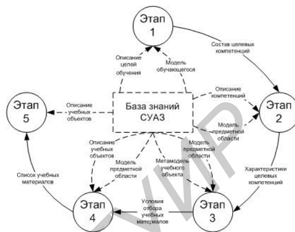
Рисунок 2 – Порядок формирования индивидуальных компетентностно-ориентированных УМК

Рассмотрим далее каждый из этапов подробнее.