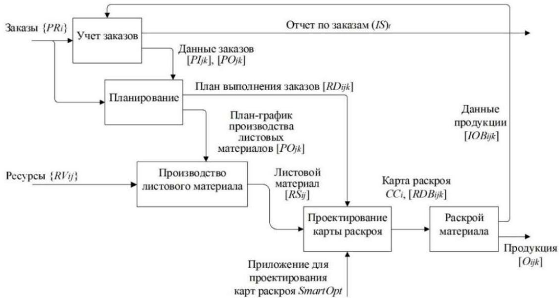
Рис. 1. Функциональная модель производства Fig. 1. Functional production model

Для описания функциональной модели производства используются переменные: \{PR_i\} – множество заказов на поставку продукции (см. рис. 1); (IS)_t – отчет о заказах за период t ; \{RV_{ij}\} – матрица потребностей в i -м ресурсе в j -м интервале планирования для выполнения плана-графика производства продукции; [PS_{ij}] – матрица изготовленной продукции i -го вида в j -м периоде; [O_{ijk}] – матрица продукции i -го вида в j -м интервале планирования по k -му заказу; \{RV_{ij}\} – матрица потребностей в i -м ресурсе в j -м интервале планирования для выполнения плана-графика производства листового материала; [PI_{jk}], [PO_{jk}] – матрицы выполненных и невыполненных требований по изготовлению продукции в j -м интервале планирования по k -му заказу; [RD_{ijk}] – матрица объема i -го вида ресурса в j -м интервале планирования по k -му заказу; [RS_{ij}] – матрица объема листового материала i -го вида в j -м периоде; [SD_{ij}] – матрица объема изготовления i -го вида материала в j -м интервале планирования; [IO_{ijk}] – матрица объема продукции i -го вида в j -м интервале планирования по k -му заказу; SmartOpt – приложение, проектирующее карты раскроя согласно плану выполнения заказов на изготовление продукции; [RDB_{ijk}] – матрица заказов i -го вида в j -м интервале планирования по k -му заказу; CC_i – карта раскроя, показывающая расположение изделий в соответствии с i -м заказом на листовом материале.