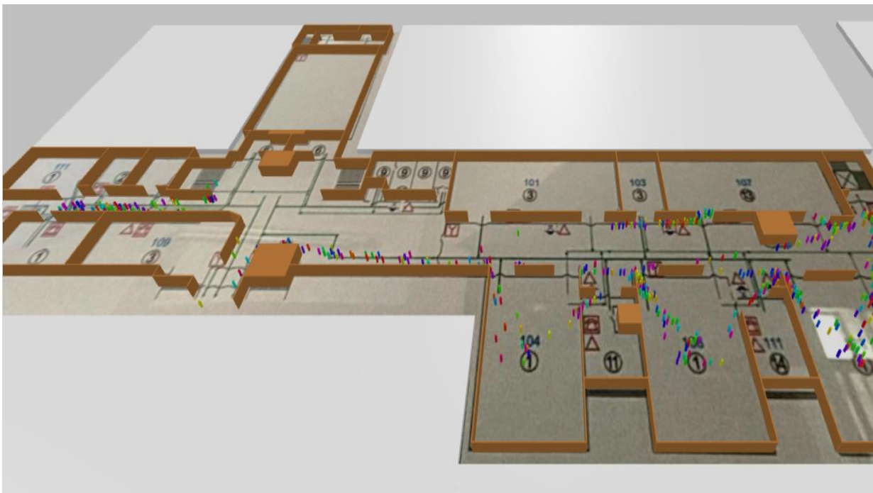
Рисунок 1 – Модель эвакуации

Также во время моделирования был построен график, показывающий зависимость количества людей в здании от пройденного времени с начала эвакуации (рисунок 2). Исходя из которого уже через 3 минуты половина людей успешно эвакуирована.