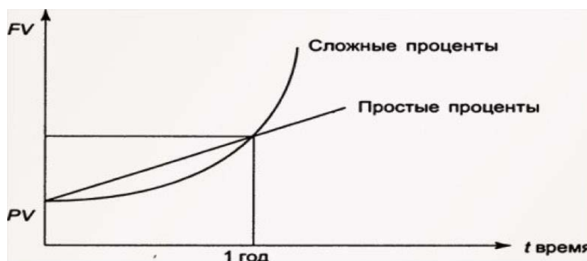
Рисунок 1 – Изменение простых и сложных процентов по вкладу

Второй вариант применяется для вкладов с капитализацией. Проценты автоматически прибавляются к телу депозита, и каждый последующий раз профит начисляется на новую, уже увеличенную сумму.