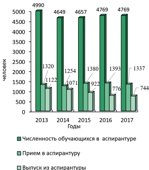
Рис. 1. Динамика изменения количественных показателей подготовки НРВК в системе аспирантуры Fig. 1. Dynamics of changes in the quantitative indicators of the preparation of NRVC in the postgraduate system

Проведенный на основе данных АСМ НРВК анализ динамики изменения показателей подготовки НРВК в системе аспирантуры показывает, что за последние пять лет численность