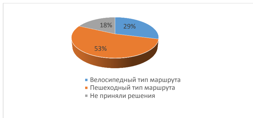
Рисунок 2 – Результаты опроса

По итогам опроса мы смогли сделать следующие выводы: в связи с тем, что экотуризм не является популярным видом туризма и не таким разрекламированным как к примеру туры, в Турцию или Египет, подростки не знакомы с ним, а, следовательно, мало заинтересованы в участии в экологическом маршруте.