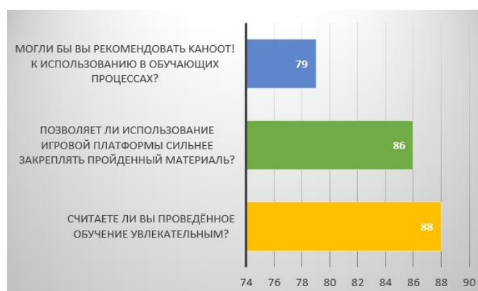
Рисунок 2 – Результаты обратной связи от опрашиваемых студентов

86 студентов были убеждены в том, что данный способ позволяет сильнее закреплять полученные знания и 79 студентов могли бы рекомендовать данную платформу к использованию на постоянной основе в обучающих процессах, трое опрошенных воздержалось от ответа. Результаты представлены на рисунке 2 [3].