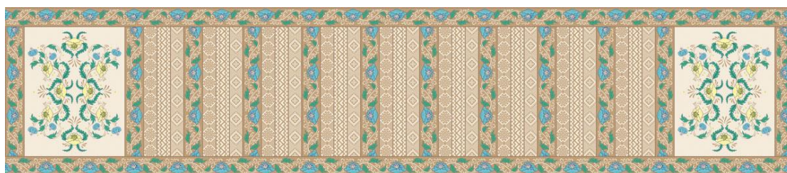
Рысунак 2 – Аднабаковы пояс

Па характару малюнка вырабы слуцкай персіяры можна падзяліць на чатыры віды. Першы складаюць аднабаковыя паясы (маецца знешні і адваротныя бакі) (рысунак 2).