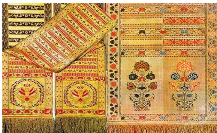
Рисунок 5 – Двухбакавы чатырохліцавы

Чацвёрты від – двухбаковыя чатырохліцавыя паясы. Яны складваліся ўдвая, і кожны з бакоў выкарыстоўваўся як ліцавы (рысунак 5).