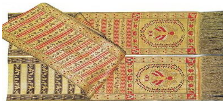
Рисунок 4 – Двухбаковы пояс

Трэці від складаюць двухбаковыя тканіны (маглі быць трохліцавымі) (рысунак 4).