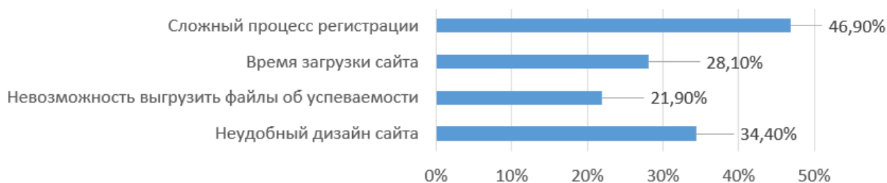
Рисунок 2 – Факторы, сдерживающие использование онлайн-сервисов Электронный журнал/Электронный дневник

время загрузки сайта; 21,9% – невозможность выгрузки файлов с данными об успеваемости (рисунок 2).