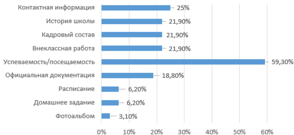
Рисунок 1 – Контент сайта, представляющий интерес для родителей, учащихся и учителей

Анкетирование показало, что учащиеся и их родители проявили высокую заинтересованность в развитии сервисов электронный журнал и электронный дневник – 59,9% опрошенных респондентов интересуют вопросы успеваемости и посещаемости (рисунок 1).