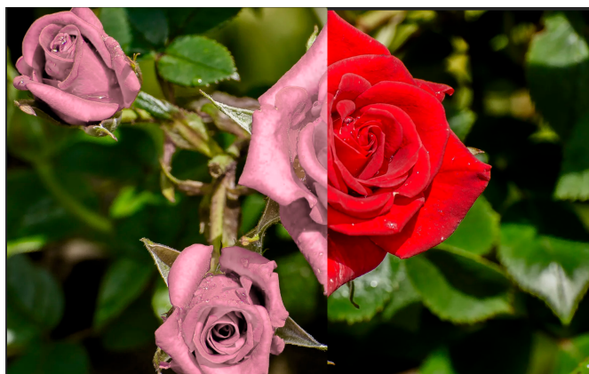
Рисунок 10 – Сравнение исходного и обработанного фото розы