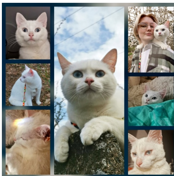
Рисунок 11 - Коллаж

Каждая версия Adobe Photoshop включает в себя множество новых функций и улучшений, которые делают программу еще более мощной и удобной для практического использо-