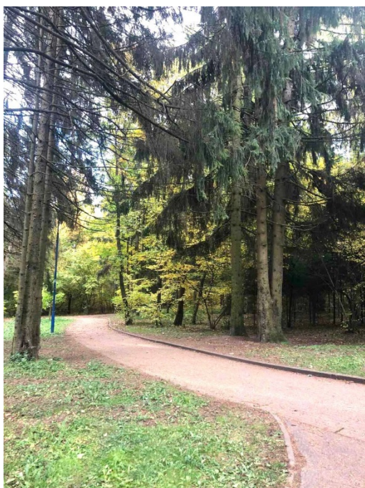
Рисунок 1 – Исходное фото