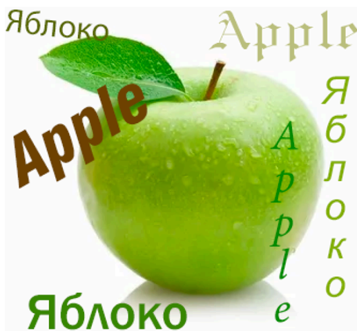
Рисунок 4 – Фото яблока с использованием разных шрифтов