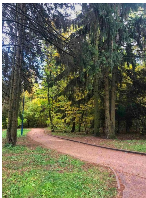
Рисунок 2 – Отредактированное фото