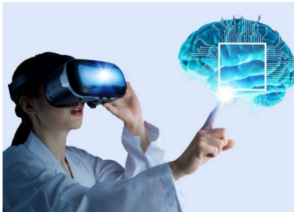
Рисунок 1 – Использование девайсов виртуальной реальности