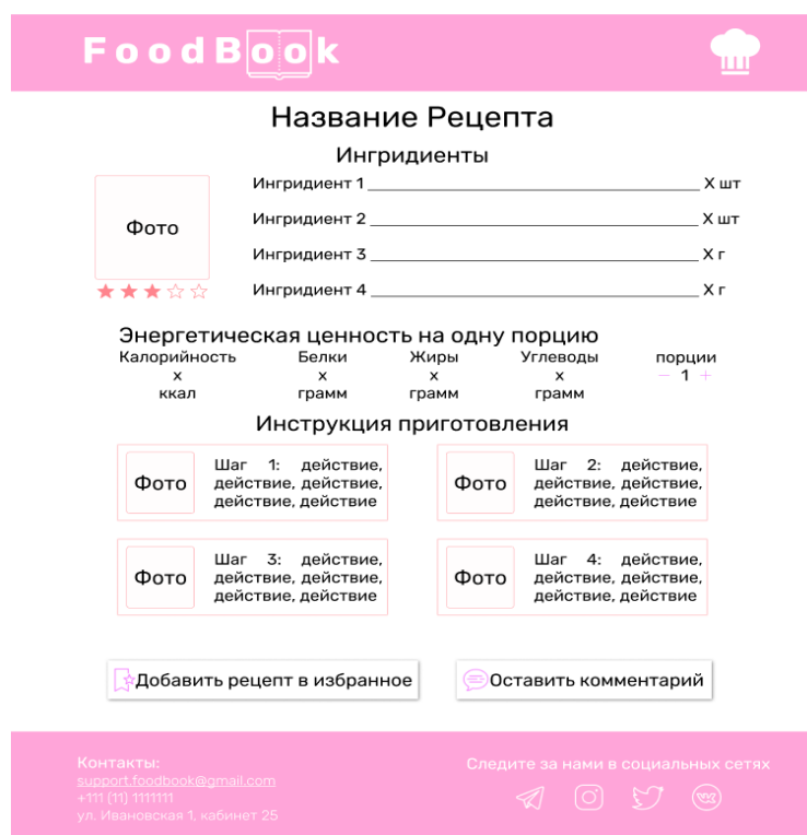
Рисунок 2 – Страница с рецептом

По сравнению с аналогами преимущество данного веб-приложения состоит в интеграции с самыми популярными социальными сетями и в наличии автоматического подсчета энергетической ценности приготовленного блюда.