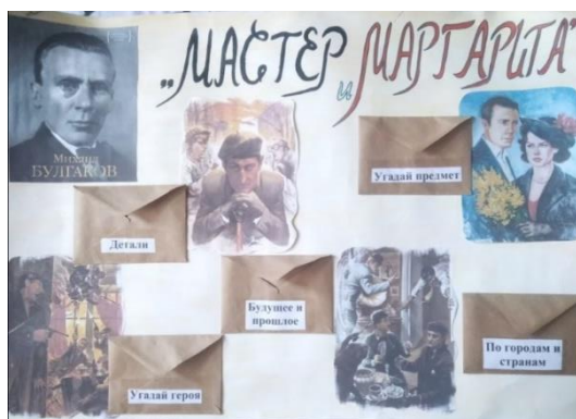
Рис. 1. Проектная деятельность