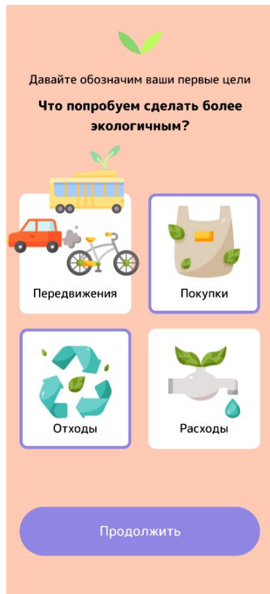
Рисунок 1 – Экран выбора целей для формирования на их основе экологических привычек

Для дополнительной мотивации пользователей в веб-приложении «Be Eco» применена ещё одна техника геймификации – доски лидеров. Пользователь может посмотреть своё место в рейтинге за неделю и за всё время существования приложения, что позволяет создавать ощущение здоровой конкуренции внутри платформы (рисунок 2).