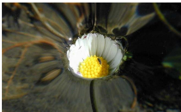
Рисунок 1 – Наглядное поверхностное натяжение

Поверхностное натяжение – это величина, которая показывает стремление жидкости сократить свою свободную поверхность, то есть уменьшить избыток своей потенциальной энергии на границе раздела с газообразной фазой. Рисунок 1: