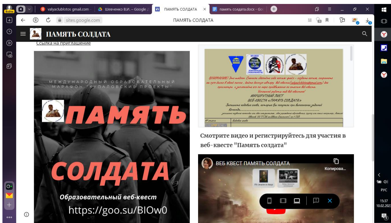
Рисунок 1 – Главная страница сайта веб-квеста

В веб-квесте «Память солдата» создана сетевая среда, которая дает возможность каждому обучающемуся продвигаться в определенном темпе, находить и размещать информацию в оптимальном объеме, участвовать в коммуникации с участниками проекта в реальном и отсроченном времени, взаимодействовать с обучающимися других школ, городов, стран. При этом все участники имеют определенную степень свободы, достаточную для возможности определять приоритеты по характеру и направленности собственной деятельности, и нести ответственность за конечный результат, каждый может стать лидером готовым к использованию своего ресурса для достижения общих целей проекта.