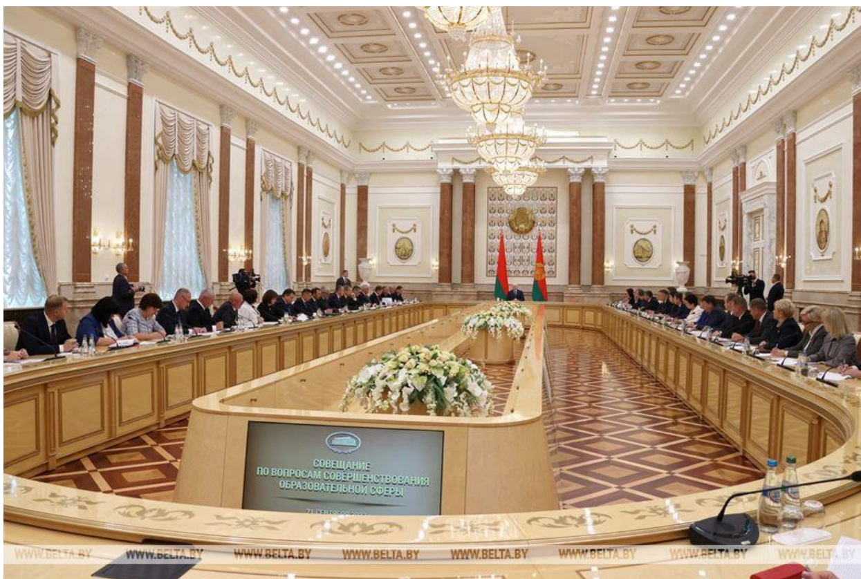
Во время совещания

"Лишь бы это было на пользу, - обозначил главное требование Александр Лукашенко. - Смотрите, чтобы не было противоречий между экзаменами и собеседованием. Если человек пришел, сдал отлично все экзамены, а вы его зарезали на собеседовании... Тут надо подходить очень аккуратно, осторожно".