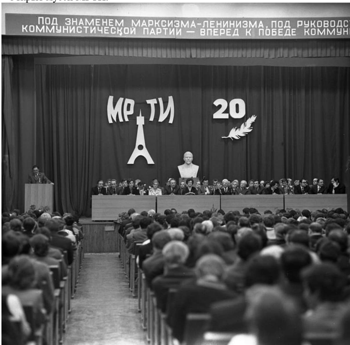
Хроника 1964-1974 гг.

Подготовлено пресс-службой Фото из хроники МРТИ