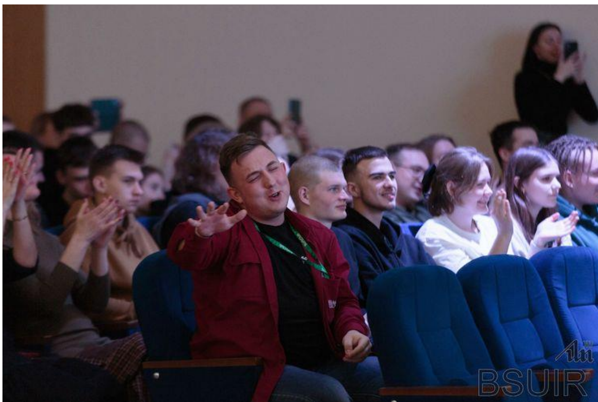
Подготовлено пресс-службой Видео Даниила Линкевича и Максима Максака