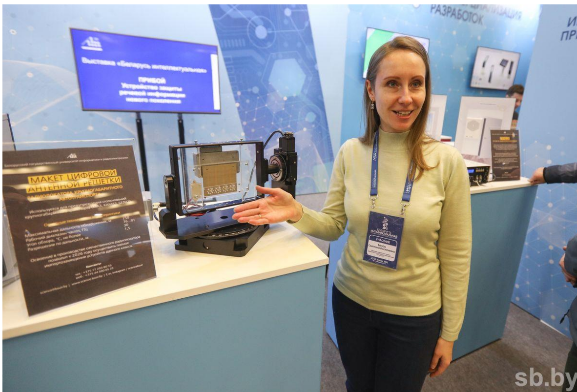
Автомобильный радар — один из важных элементов беспилотных систем.

Завершают специалисты БГУИР разработку опытного образца автомобильного радара. Он является одним из элементов для внедрения беспилотных систем в белорусском машиностроении. Университет разрабатывает различные комплексы (и программные, и аппаратные) для решения задач электромагнитной совместимости и электромагнитной безопасности. Это и модели, и расчеты, и натурные измерения, которые в том числе используются для оптимизации работы средств связи, передачи и приема информации, обеспечения необходимых условий для развертывания коммуникационных сетей нового поколения, например 5G.