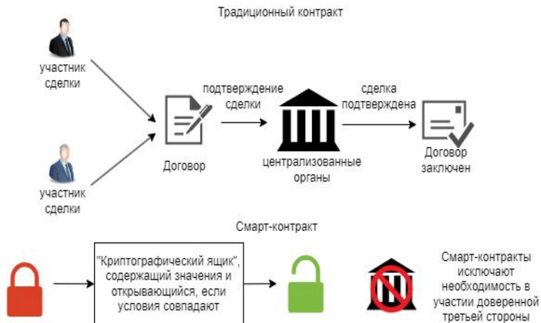
Рисунок 1. Сравнение контракта со смарт-контрактом

адвокаты или нотариусы, а их исполнение и регулирование требуют дополнительных шагов и вмешательства третьих сторон в случае нарушения. Как видно на схеме, смарт-контракт упрощает процесс заключения сделки, облегчая задачу для сторон договора.