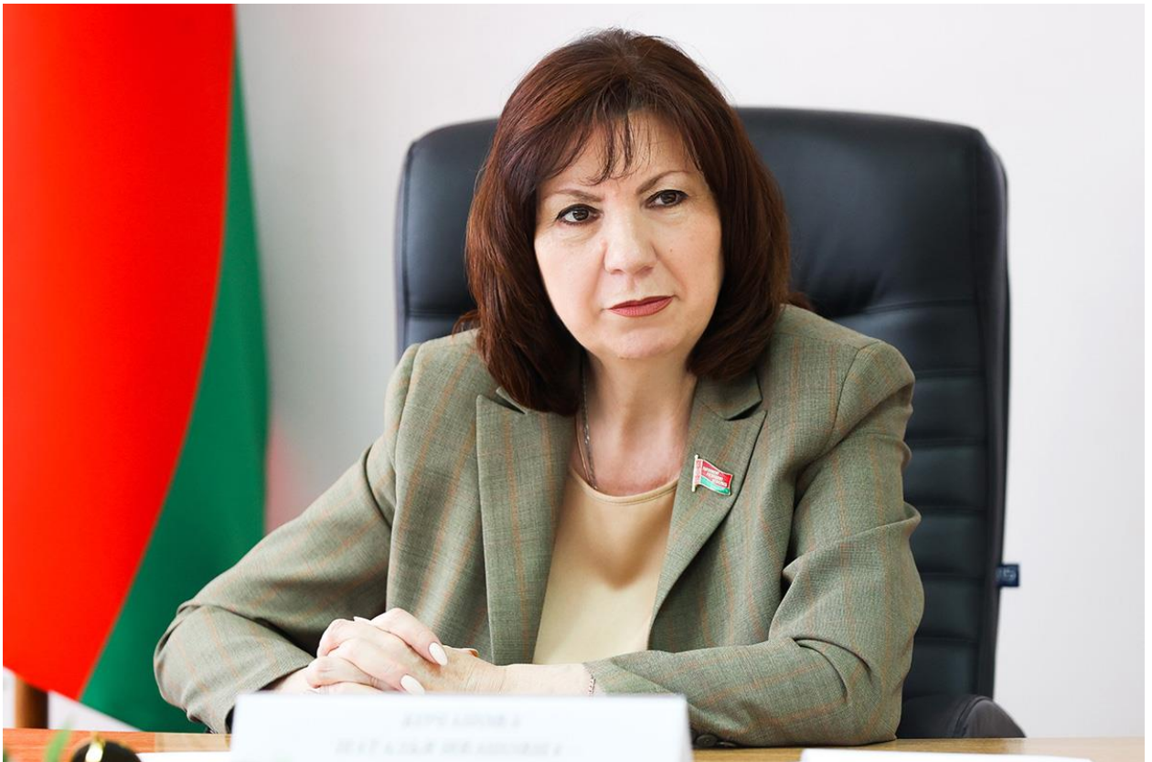
Личный прием Натальи КОЧАНОВОЙ продолжался в течение всего дня.

Жительнице Барановичей нужна операция по замене тазобедренного сустава, который стремительно разрушается. На платную у нее не хватает денег. Она стоит в очереди на операцию за счет бюджета, просит ускорить процесс. Женщина ведет активный образ жизни, преподает в гимназии. С похожей проблемой столкнулась и жительница Ганцевичей — ее беспокоят сильные боли. В очереди стоит с августа 2021 года.