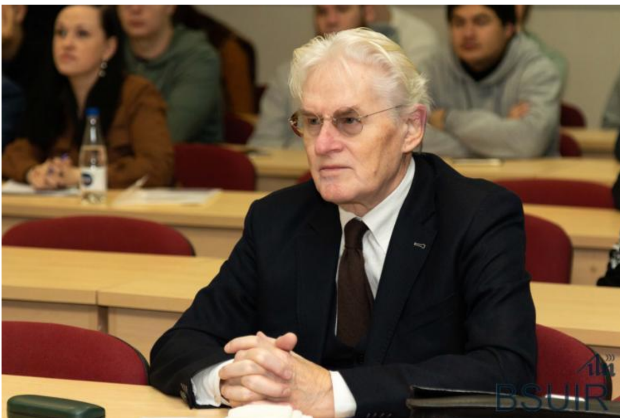
Подготовлено пресс-службой