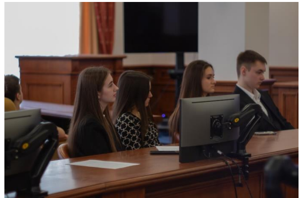
Подготовлено пресс-службой