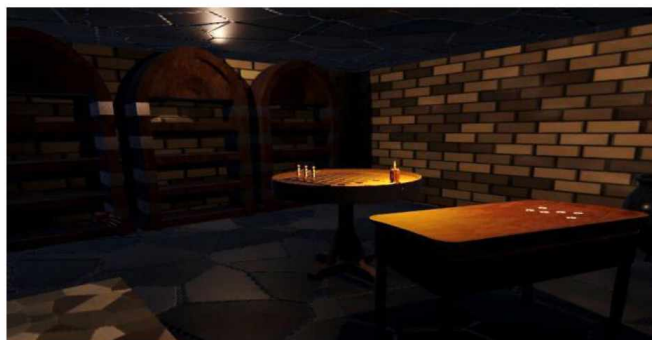
Рисунок 1 – Комната в средневековой тематике, предназначенная для виртуальной стратегической игры

светильниками, стратегически расположенными над столами, создавая интенсивную и сосредоточенную атмосферу для игры.