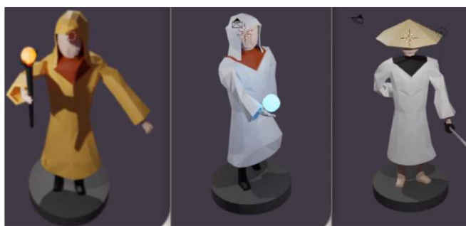
Рисунок 3 – Низкополигональный дизайн персонажей: пиромант, жрец и самурай

Blender использовался для создания 3D-моделей. Фигуры в игре выполнены в низкополигональном стиле, который представляет собой технику, использующую ограниченное количество полигонов для представления фигур (рисунок 3).