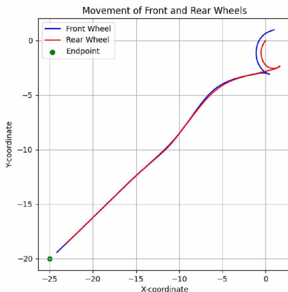
Рисунок 3 – Траектория движения мобильной платформы с алгоритмом разворота

В результате время, необходимое мобильной платформе для достижения конечной точки, сокращено с 6,47 секунды (до использования алгоритма регулирования скорости) до 4,24 секунд.