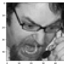
Рисунок 1 – Изображение из обучающей выборки