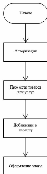
Рисунок 3 – Алгоритм взаимодействия пользователя с веб-сайтом интернет-магазина

Также, есть возможность реализовать версии сайта для людей с ограниченными возможностями. Например, версия для слабовидящих обладает измененным дизайном, где предпочтение отдается простоте восприятия: использование контрастных цветов, крупный шрифт без засечек, исключение мелких элементов и т.п. Благодаря достаточному развитию TTS-сервисов, также реализуема функция озвучивания текста при наведении на него мышью.