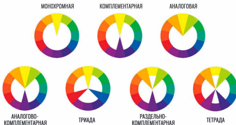
Рисунок 2 – Цветовые схемы

Немаловажным является также оформление сайта. При отсутствии каких-либо творческих элементов, основой дизайна служат цветовые схемы – сочетания цветов, наиболее хорошо воспринимаемые человеком. Для определенных направленностей сайта применимы разные цветовые схемы, основные указаны на рисунке 2.