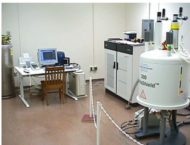
Рисунок 3 – ЯМР-спектрометр (справа)

Основных недостатков у ЯМР два. Во-первых, это низкая чувствительность по сравнению с большинством других экспериментальных методов (оптическая спектроскопия, флуоресценция, ЭПР и т. п.). Это приводит к тому, что для усреднения шумов сигнал нужно накапливать долгое время. В некоторых случаях ЯМР-эксперимент может проводиться в течении даже нескольких недель. Во-вторых, это его дороговизна. ЯМР-спектрометры – одни из самых дорогих научных приборов, их стоимость измеряется как минимум сотнями тысяч долларов, а самые дорогие спектрометры стоят несколько миллионов. Фотоснимок ЯМР-спектрометра представлен на рисунке 3.