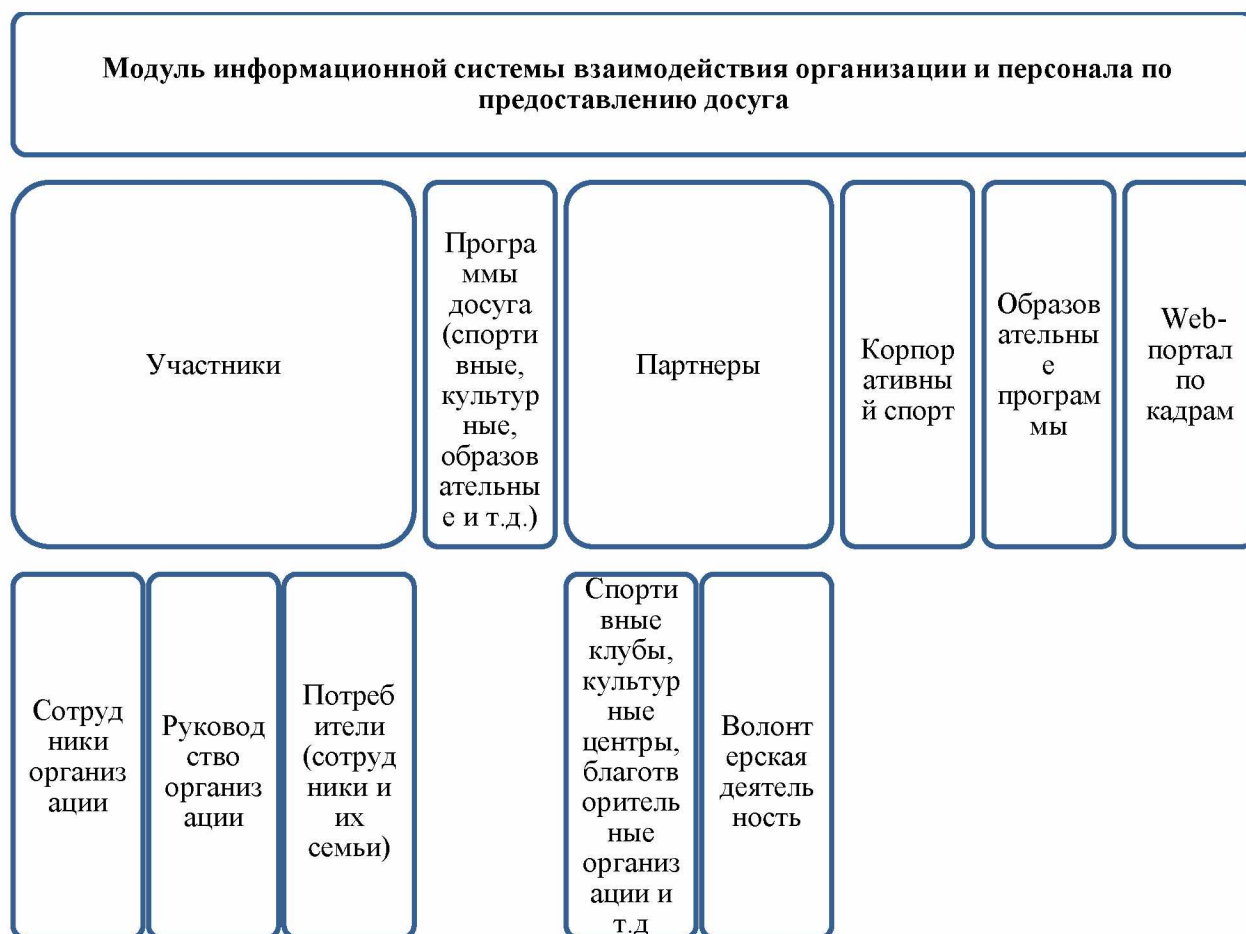
Рисунок 1 – Графическая модель модуля и его компонентов

Модуль информационной системы взаимодействия организации и персонала по предоставлению досуга с учетом его компонентов графически можно представить следующим образом (рисунок 1).