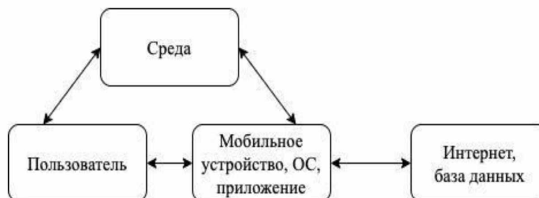
Рисунок 2 – Структурная схема

Также для системы была разработана структурная схема, представленная на рисунке 2, показывающая все взаимодействия во время использования приложения.