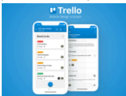
Рисунок 4 - Интерфейс Trello

4. Решение узконаправленной задачи. Например, для планирования рабочего дня, для редактирования фото или видеоконтента, для работы с рекламным кабинетом, для общения в социальных сетях, для трекинга рабочего времени сотрудников и отслеживания выполнения ими задач и т.п. Одним из примеров узконаправленного специализированного приложения может быть Trello.