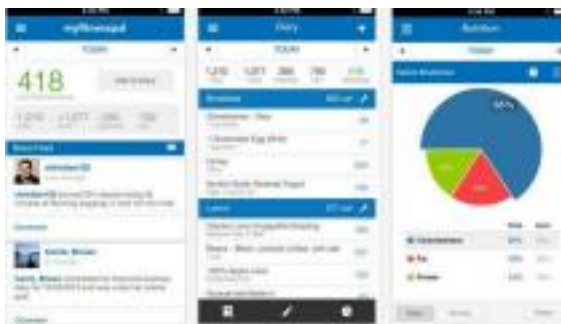
Рисунок 2 - Интерфейс MyFitnessPal

Пользователи могут вести дневник своего питания, отслеживать количество потребляемых калорий, белков, жиров и углеводов, а также регистрировать свои тренировки и активность. 3. Автоматизация процессов внутри компании.