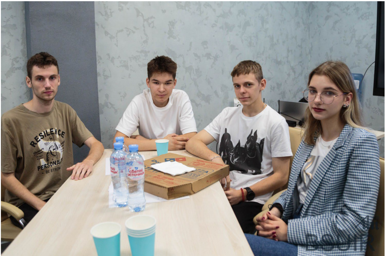
Подготовлено пресс-службой