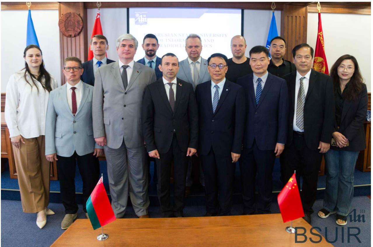
Подготовлено пресс-службой