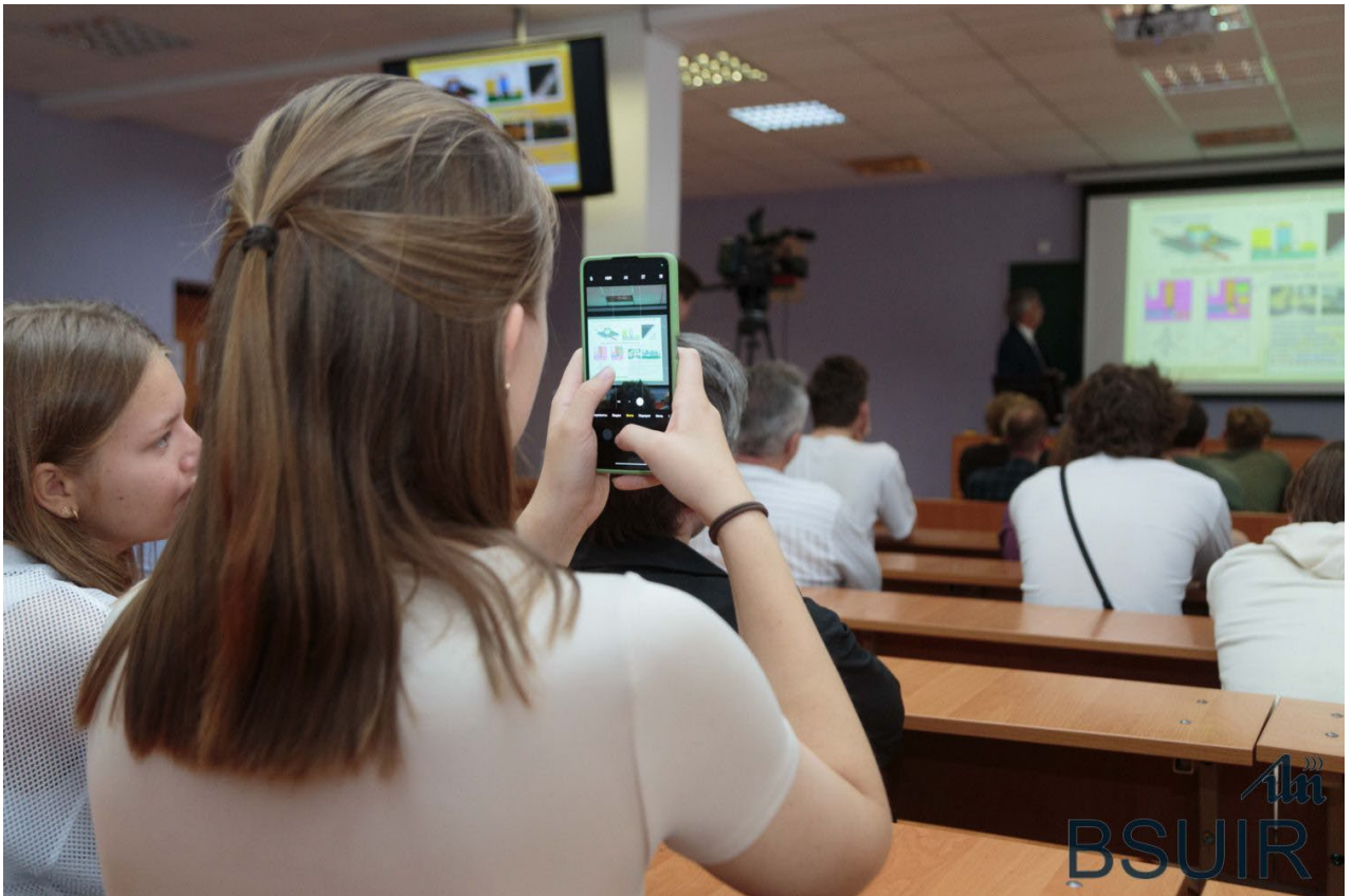
Подготовлено пресс-службой Фото Андрея Синявского