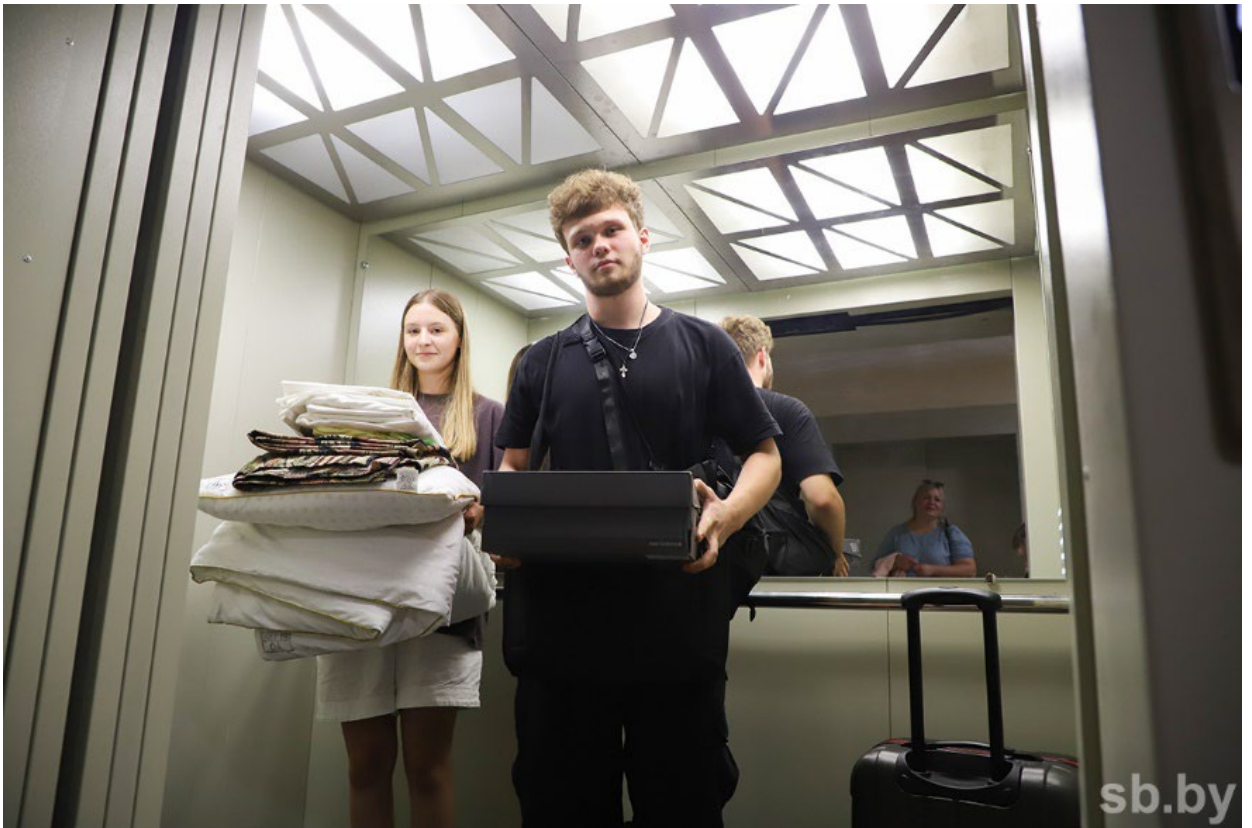
Новоселы общежития отправляются по комнатам.