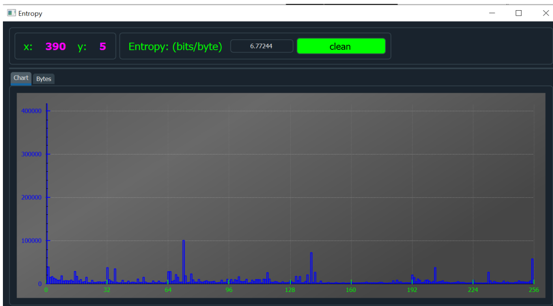
Рисунок 2 – Гистограмма эмпирической плотности распределения для не упакованного файла