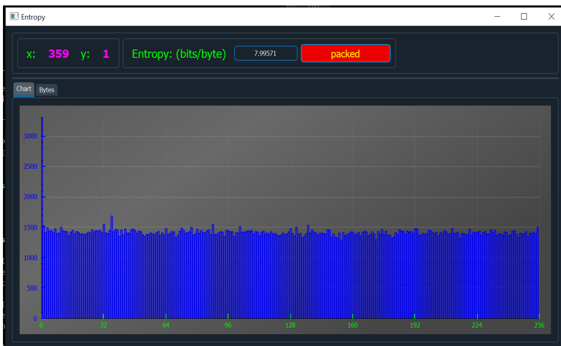
Рисунок 1 – Гистограмма эмпирической плотности распределения для упакованного файла

Пример гистограммы эмпирической плотности распределения представлены на рисунках 1 и 2.