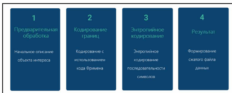
Рисунок 2 – Алгоритм обработки полигональных данных

Алгоритм обработки данных наблюдения реализуется через вычислительные этапы (рис. 2).