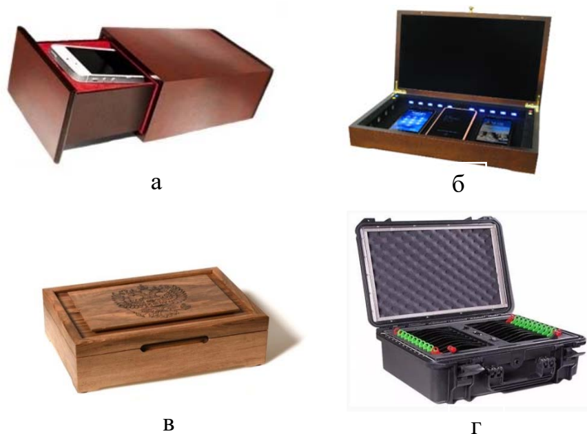
Рис. 3 Типовые модели акустических сейфов: а – «ЛАГ-103», предназначенный для защиты одного мобильного телефона; б – «ЛАРЕЦ-УЗ-УФ», многоместный; в – «УЛЬТРА», представленный в виде компактного футляра типа камеры Фарадея; г – «СКАТ-22», выполненный в виде защитного короба

Внешний вид типовых акустических сейфов в различном исполнении согласно некоторым классификационным характеристикам представлен на рисунке 3. Основные характеристики представленных акустических сейфов приведены в таблице 1 [6-9].