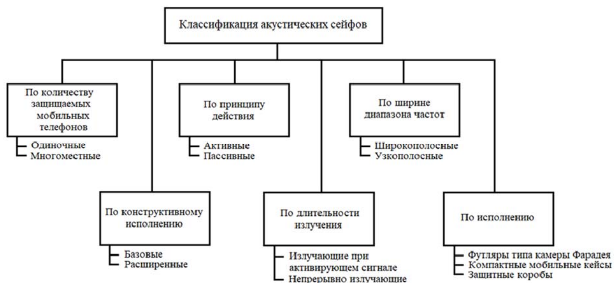
Рис. 2 Классификация акустических сейфов

В связи с разнообразием различных моделей акустических сейфов, появившихся на рынке за последнее время, представляется целесообразным проведение их общей классификации по различным признакам, которая приведена на рисунке 2.