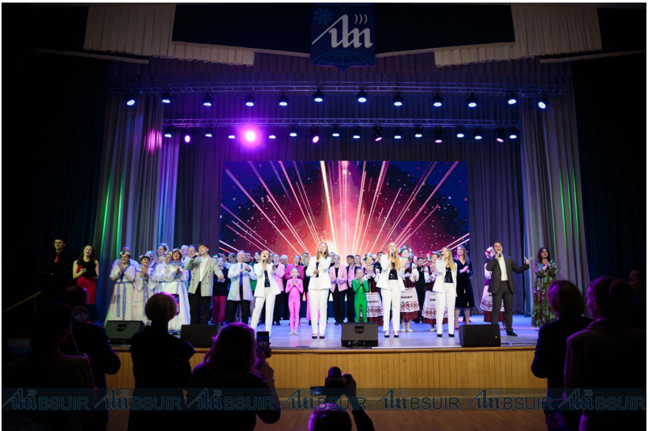
Подготовлено пресс-службой