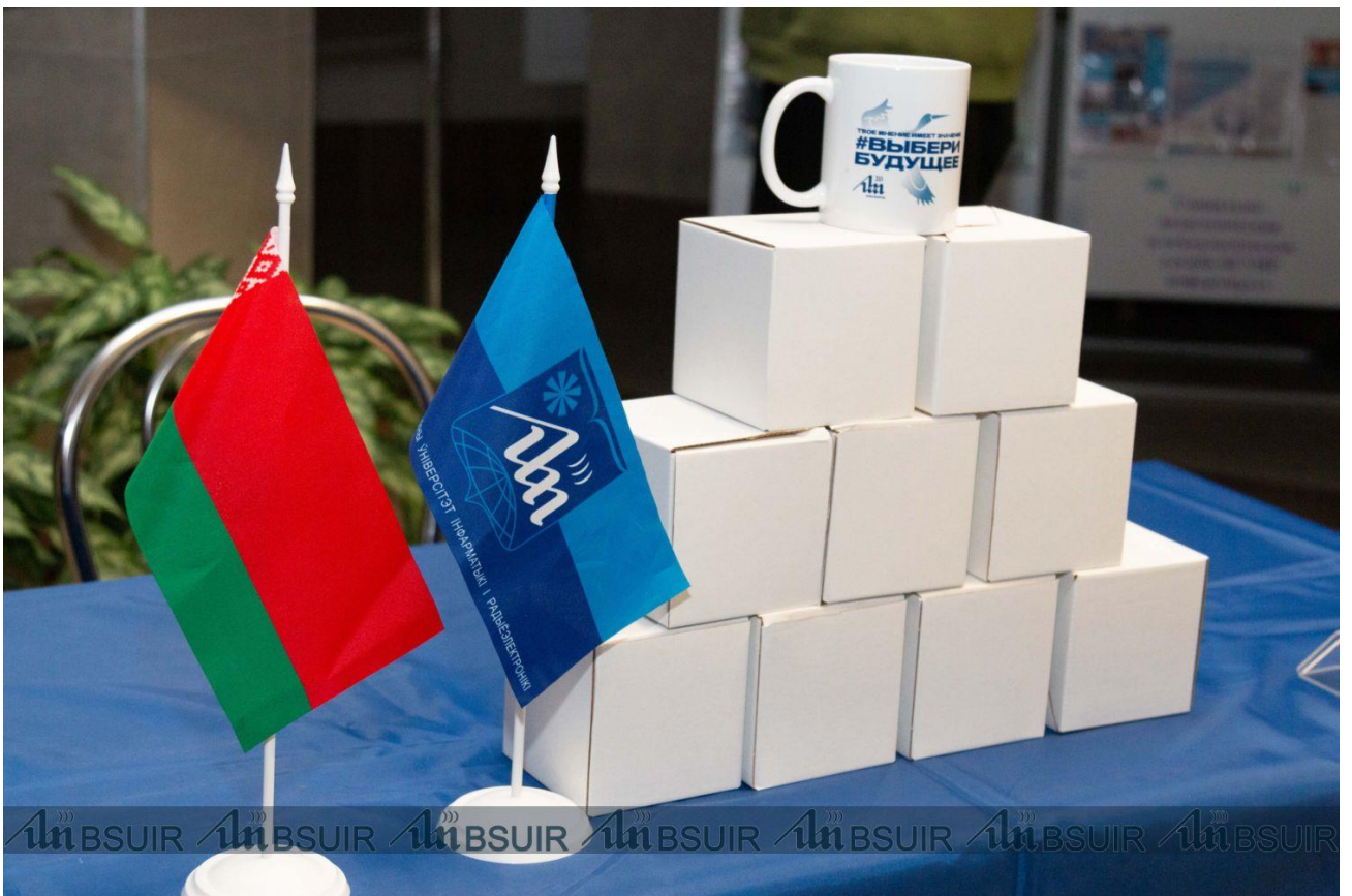
Подготовлено пресс-службой