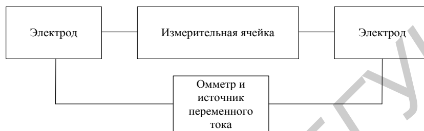
Рис. 1. Схема соединения элементов измерительной системы при измерении сопротивления влагосодержащего порошкообразного перлита

Для измерения значений коэффициентов передачи и отражения ЭМИ в диапазоне частот 0,7...17 ГГц влагосодержащего порошкообразного перлита выполнялось заполнение им емкостей, изготовленных из радиопрозрачного материала. Расстояние между большими торцами этих емкостей составляло 10 мм. Измерения значений коэффициентов передачи и отражения ЭМИ в диапазоне частот 0,7...17 ГГц выполнялись согласно методике, представленной в [11].