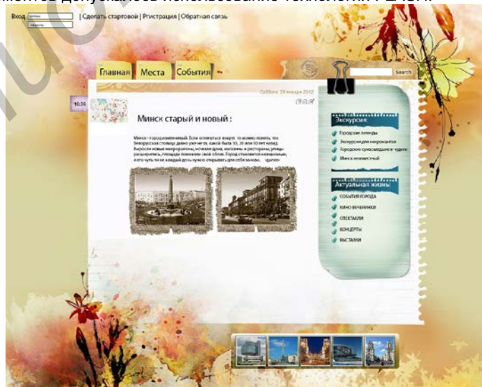
Рис. 1 – Пример культурно-туристического сайта

Для реализации дизайна веб-сайта использовался язык HTML и CSS, при необходимости для создания отдельных графических элементов допускалось использование технологии FLASH.