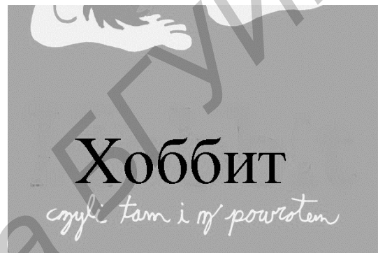
Рис.2. Результат работы команды «Translate»

этот блок посылается на сервер с Ocrad OCR — прикладной сервис с открытым кодом для распознавания текста на изображениях. Данный ресурс позволяет распознать текст, находящийся в выделенном блоке. Полученный текст можно корректировать и использовать для других целей, например для перевода (рис. 2).