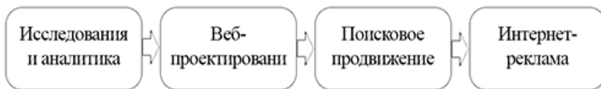
Рисунок 1 – Комплексный метод продвижения

При раскрутке веб-сайта возникает ряд проблем, которые можно решить только благодаря специальному программному обеспечению.